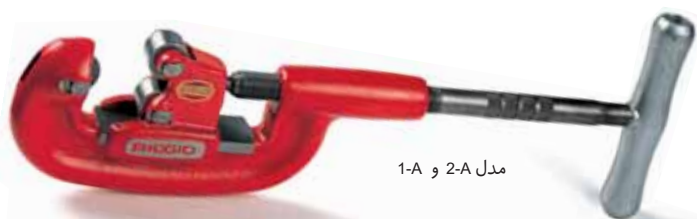
مدل 1-A و 2-A

لوله‌برهای تک چرخ را می‌توان با جایگزین نمودن چرخ برش بجای غلتکها به یک لوله‌بر سه چرخ تبدیل نمود. و یا از ابتدا لوله‌بر سه چرخ سفارش داده شود برای مکانهایی که لوله‌بر بطور کامل قادر به دور زدن نمی‌باشد.