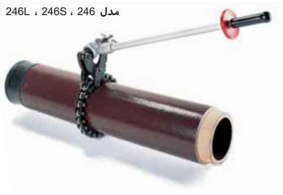
مدل 246L ، 246S ، 246

• لوله‌های سفالی، سیمانی و چدنی 2" تا 6" (150mm) را می‌برد. ایده آل برای استفاده در فضاهای محدود. پیچ تغذیه آن بسیار سریع باز می‌شود و به راحتی با آچار جفجغه و یا هر آچار دیگری مورد استفاده قرار می‌گیرد.