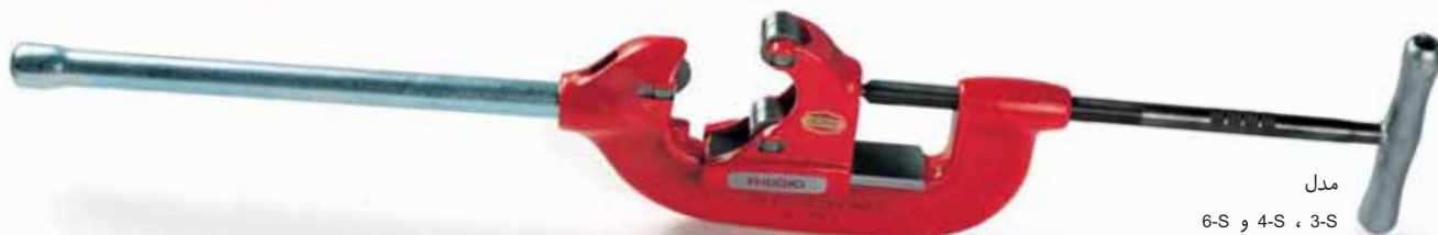
مدل 3-S ، 4-S و 6-S