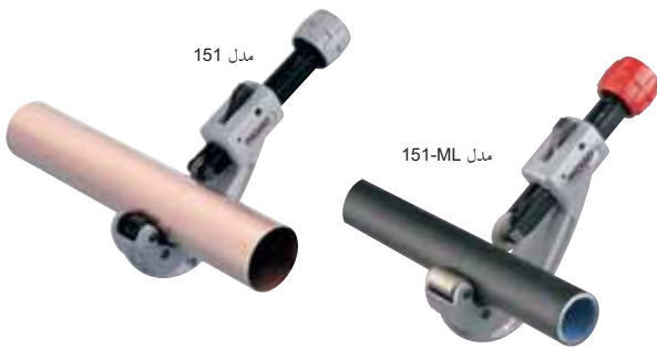
مدلهای 151 ، 154 ، 153 ، 156